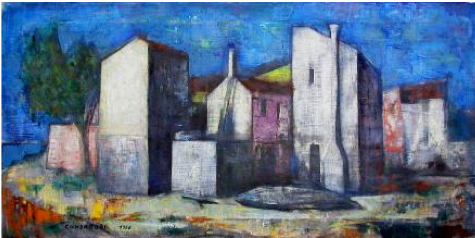
Dipinto olio su tela di Silvio Consadori, anno 1960. Nome dell'opera: "Terranova"

Collezione del Comm. Guglielmo Coppola, socio Sostenitore della Società La Permanente Milano.